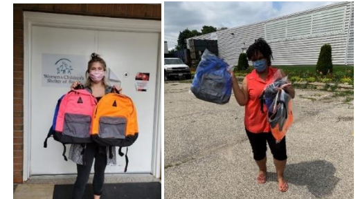
Partenaires communautaires du programme Sacs à dos pour les enfants

Le programme annuel Sacs à dos pour les enfants de Bell soutient les élèves partout au Canada, les aidant ainsi à bien commencer l'année scolaire. Depuis que le programme a vu le jour, les membres de l'équipe Bell ont rempli plus de 100 000 sacs à dos de fournitures scolaires destinées aux élèves du primaire. Comme il n'était pas possible de remplir des sacs à dos en 2020 en raison de la COVID-19, Bell a fait don de 90 000 $ pour couvrir le coût des fournitures scolaires ainsi que ceux de plus de 3 800 sacs à dos à des partenaires communautaires à l'échelle du pays. Les membres de l'équipe Bell partout au Canada ont également fait des dons personnels aux organismes locaux par l'entremise du programme Donner des employés de l'entreprise.