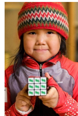
Participante au programme Learn to Speed Skate de Northwestel

Si cette fiche d'information contient des déclarations prospectives, y compris, sans s'y limiter, sur nos perspectives commerciales, plans, objectifs, priorités stratégiques, engagements, ainsi que d'autres déclarations qui ne renvoient pas à des faits historiques, ces déclarations ne représentent pas une garantie de la performance ni des événements futurs, et nous mettons en garde le lecteur contre le risque que représente le fait de s'appuyer sur ces déclarations prospectives. Les déclarations prospectives sont l'objet de risques et d'incertitudes et reposent sur des hypothèses donnant lieu à la possibilité que les résultats ou les événements réels diffèrent de façon significative des attentes exprimées ou sous-entendues dans ces déclarations prospectives. Se reporter au plus récent rapport de gestion annuel de BCE Inc., mis à jour dans les rapports de gestion trimestriels ultérieurs de BCE Inc., pour obtenir plus d'information au sujet de ces risques, incertitudes et hypothèses. Les rapports de gestion de BCE Inc. sont disponibles sur son site web à bce.ca , sur SEDAR à sedar.com et sur EDGAR à sec.gov .