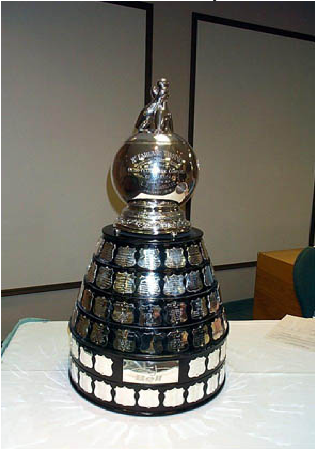
Le Trophée de Quilles McFarlane