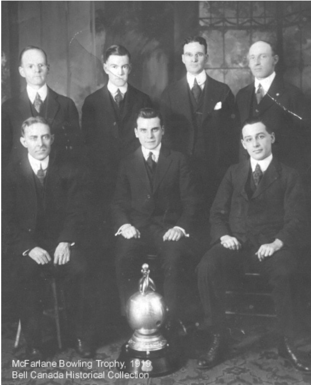
McFarlane Bowling Trophy, 1919 Bell Canada Historical Collection